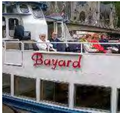
Le 27 juillet, croisière de Dinant à Givet