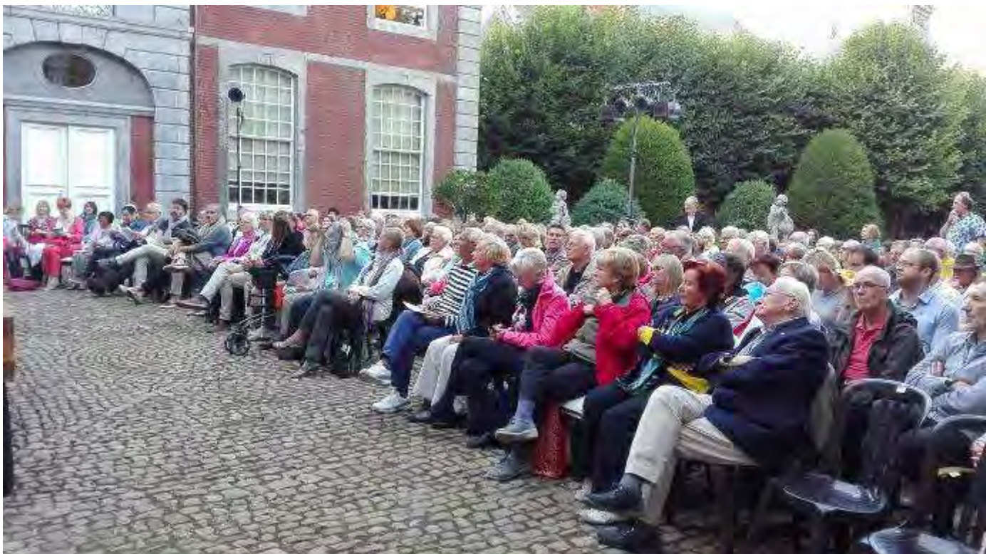
L'assistance au théâtre en juillet 2017