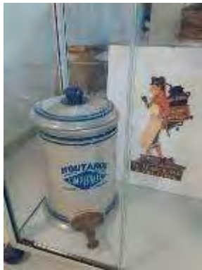
Le 19 juillet, visite de la moutarderie Bister