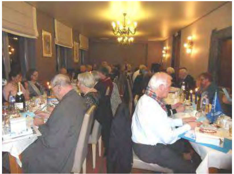
Une réunion de club