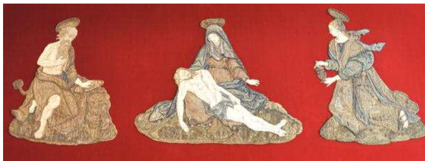
Devant d'autel, fin XVIe

De nombreux ornements liturgiques anciens, redécouverts dans la sacristie de la cathédrale, étudiés et restaurés par la Direction régionale des affaires culturelles Grand Est depuis 2010, sont dévoilés dans l'exposition, notamment une chasuble en velours du XV e siècle, l'ornement du cardinal de Lorraine du XVI e siècle, ou encore le dais offert par Louis XIII et Anne d'Autriche à l'abbaye de Saint-Remi.