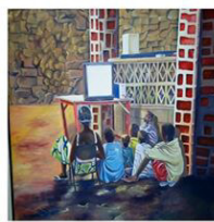
SANOU Moustapha (Anou)