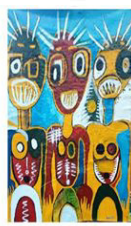
Oumar OUARMA (Ouarm' Art)