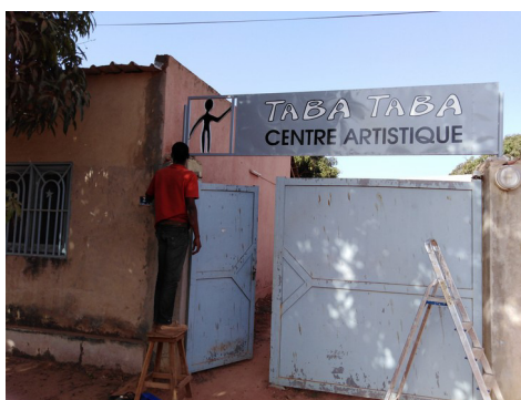
Installation de l'enseigne, février 2019

Le projet TABA TABA à Bobo Dioulasso se développe ! Après la construction d'un espace de soutien scolaire pour les enfants du quartier, subsidié par le club Richelieu de Namur, voici la première exposition des artistes locaux... Nous sommes tous invités au vernissage !