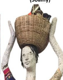
Ladji sans Papier