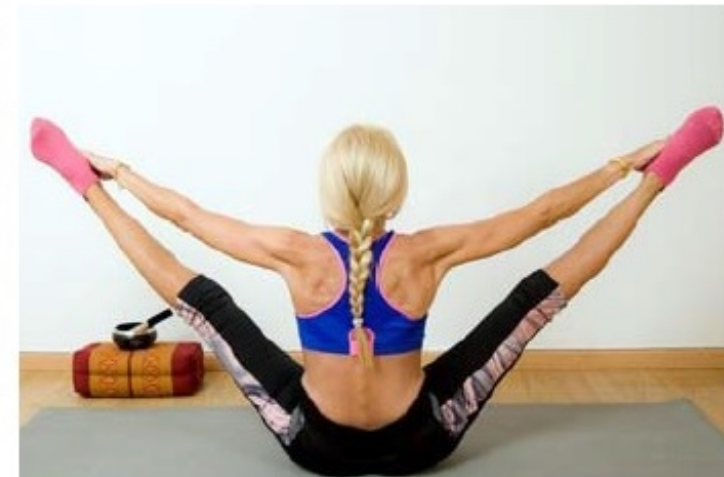
Dans une posture en équilibre.